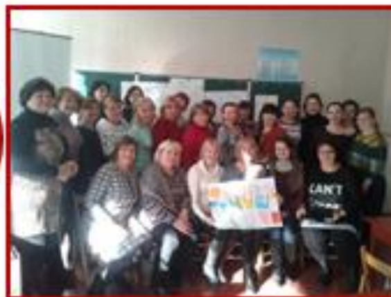
Обмін досвідом з колегами району