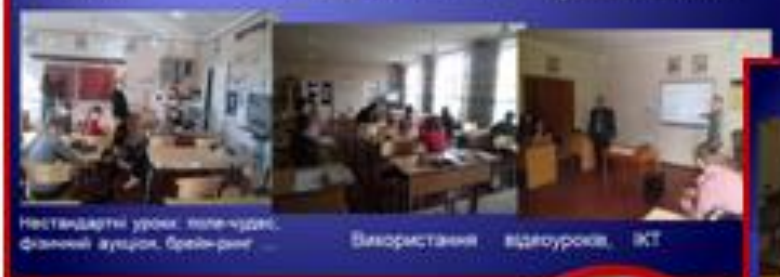
Нестандартні уроки, роль-груки, флеш-моб, аукціон, брейн-ринг