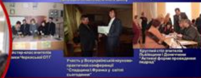
Мастер-клас вчителів м.Черкаси ОТГ