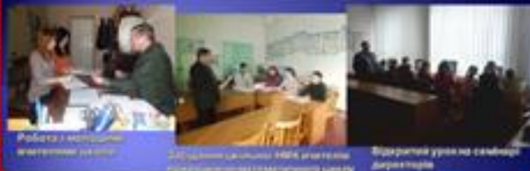
Робота з методичною комісією закладу